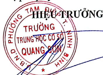
Tổng Đức Hùng